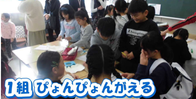
1組 びよびよかえる