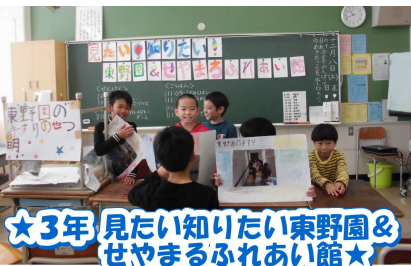
★3年 見たい知りたい東野園 & せやまるふれあい館★