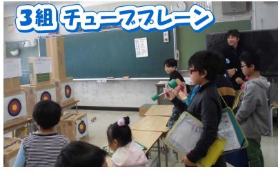
3組 チューズレーン