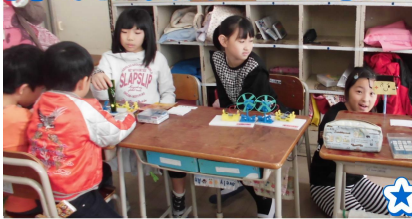
★4年 サイエンスクローバー4★