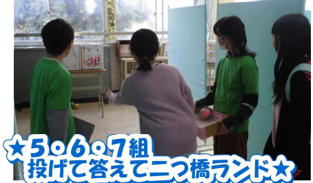
★5・6・7組 投げて答えて二つ橋ランド★