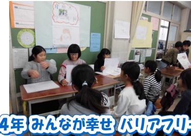
★4年 みんなが幸せ バリアフリー=4★