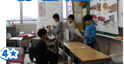
★4年 知って楽しいまちづくり ~安心・安全・大発見~★