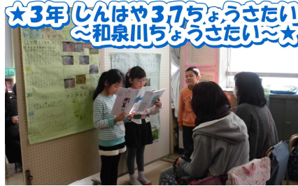
★3年 しんはや37ちようさい ~和泉川ちようさい~★