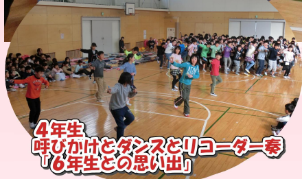
4年生 呼びかけとダンスとリコーダー奏 「6年生との思い出」

卒業生との思い出をふり返り、学年ごとに趣向を凝らして卒業生への感謝やお祝いの気持ちを伝えました。歌ったり、踊ったり、演じたり、呼びかけたりして、体育館は卒業生を思うあたたかい気持ちでいっぱいになりました。