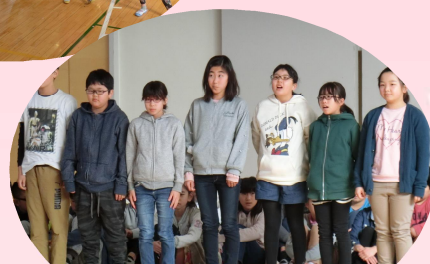
5年生/呼びかけ 「委員会での思い出・来年度の決意」

卒業生との思い出をふり返り、学年ごとに趣向を凝らして卒業生への感謝やお祝いの気持ちを伝えました。歌ったり、踊ったり、演じたり、呼びかけたりして、体育館は卒業生を思うあたたかい気持ちでいっぱいになりました。