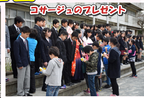
3年/コサージュのプレゼント