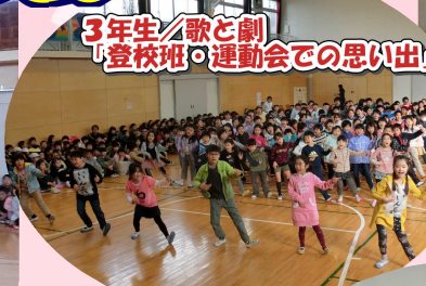
3年生/歌と劇 「登校班・運動会での思い出」