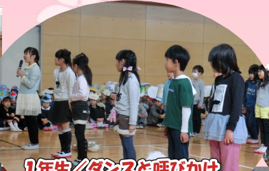
1年生/ダンスと呼びかけ 「6年生から教わったこと」