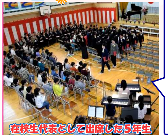
在校生代表として出席した5年生

在校生代表として卒業式に出席した5年生は、式の開始・終了を合図するトンチャイムや入退場曲を演奏しました。さらに、「別れの言葉」の歌や呼びかけでも、卒業をお祝いする気持ちをしっかり伝え、卒業生からのバトンを受け取っていました。最高学年となる自覚が一段と高まっていました。