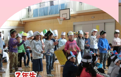
2年生 「国語で学習したことクイズ」