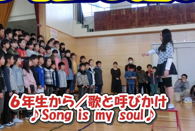
6年生から/歌と呼びかけ ♪Song is my soul♪