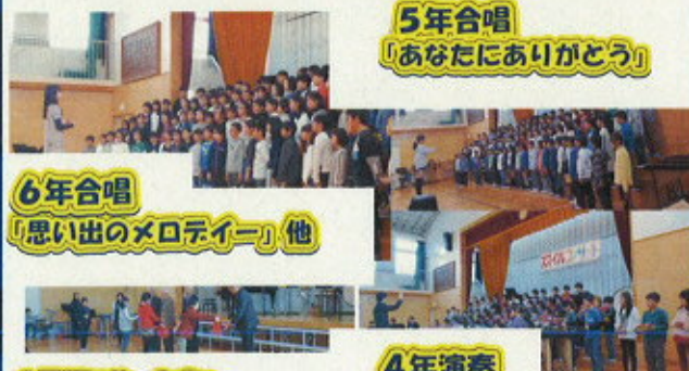
5年合唱 「あなたにありがとう」