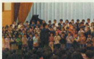
リコーダー奏「さくら笛」

合唱では澄んだ声で響かせることを、リコーダー奏ではリコーダーの指使いとタンギングに気を付けることをめあてとして学習してきました。集会では学習の成果が表れ、優しい音色になりました。