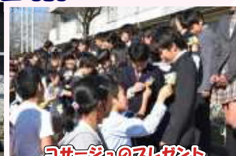
コサージュのプレゼント