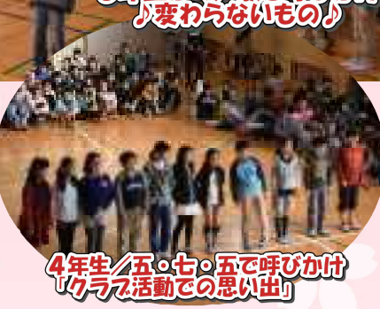
4年生/五・七・五で呼びかけ 「クラブ活動での思い出」