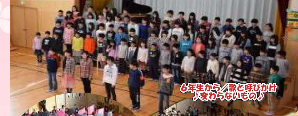
6年生から/歌と呼びかけ 「変わらないもの」