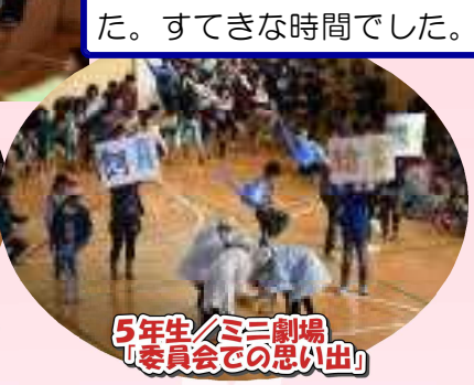
5年生/ミニ劇場 「委員会での思い出」

卒業生との思い出をふり返り、学年ごとに趣向を凝らして感謝やお祝いの気持ちを伝えました。歌ったり、踊ったり、演じたり、呼びかけたりして、体育館は卒業生を思うあたたかい気持ちでいっぱいになりました。すてきな時間でした。