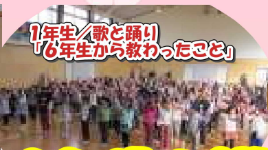
1年生/歌と踊り 「6年生から教わったこと」