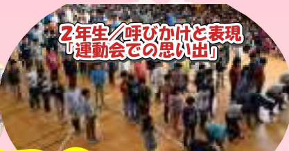
2年生/呼びかけと表現 「運動会での思い出」