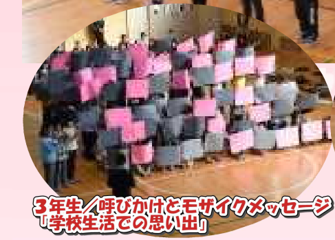
3年生/呼びかけとモザイクメッセージ 「学校生活での思い出」