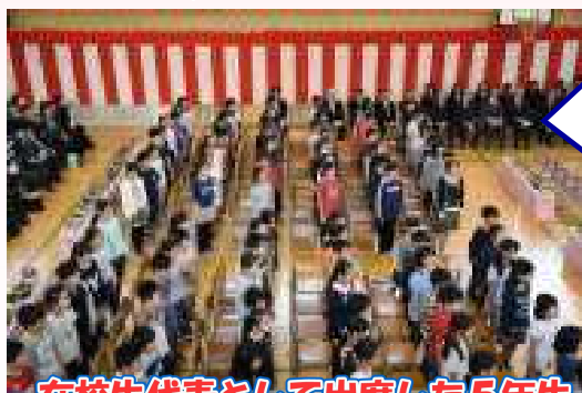
在校生代表として出席した5年生