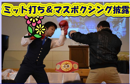
ミット打ち&マスボクシング披露