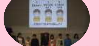
全校集会でも保健委員が発表