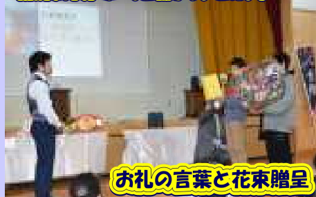
お礼の言葉と花束贈呈