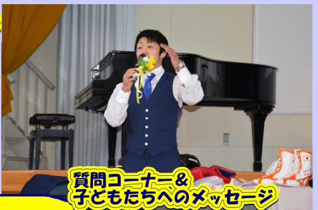
質問コーナー&子どもたちへのメッセージ