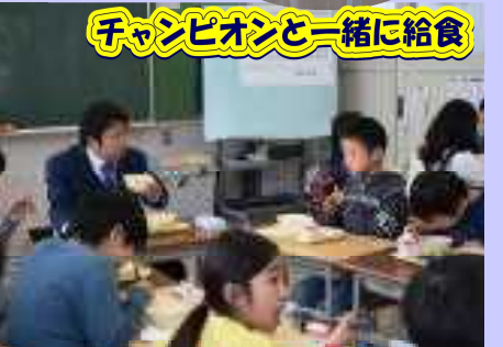
チャンピオンと一緒に給食