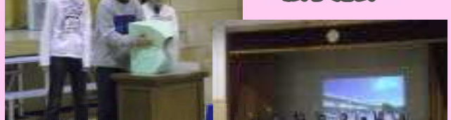
実技(ステージ)発表