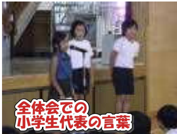
全体会での 小学生代表の言葉