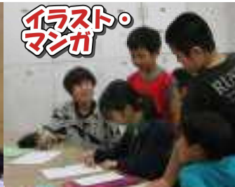
イラスト・ マンガ