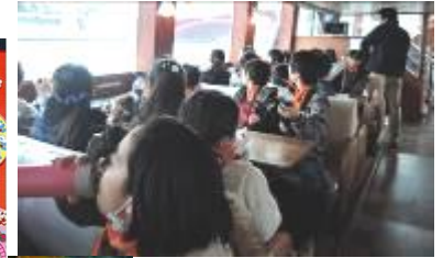
「花やしき」の後は、ゆったりと「隅田川クルーズ」。いくつもの橋をくぐり、東京の風景を満喫しました。6年生は、だれとでも楽しく過ごせる仲良し集団。帰り道、「ああ、終わっちゃった」としみじみ話しているのが印象的でした。