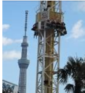
スカイツリーを見ながら、絶叫!!! 怖いけれど、おもしろい。