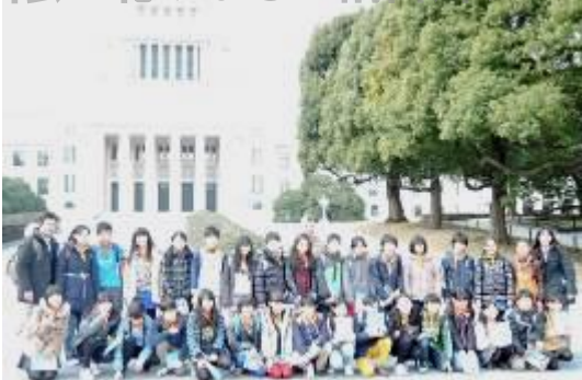
国会議事堂をバックに、写真撮影。敷地内にある県の樹木も見ってきました。神奈川県は「いちよう」です。今は、葉が1枚もありませんけれど。

国会では、予算委員会が開かれていて、会議中の部屋の前を静かに通ってきました。厳かな雰囲気をつぶり味わってきました。その後は、お楽しみの「花やしき」と「隅田川クルーズ」。小学校生活最後の校外学習は、楽しいお出かけでした。