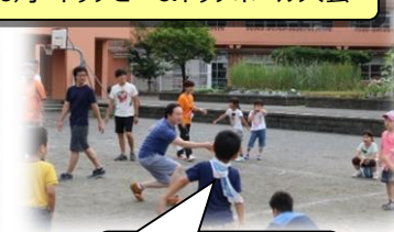
親子、先生と一緒にドッチボール・ドッチビー！