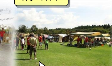
お父さんの会メンバー限定のイベント