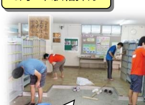
様々な形で小学校をサポートしてます