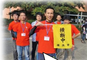
自分から挨拶できる子供たちに！の活動