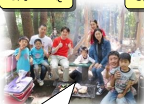
つくし野アスレチックで開催しました