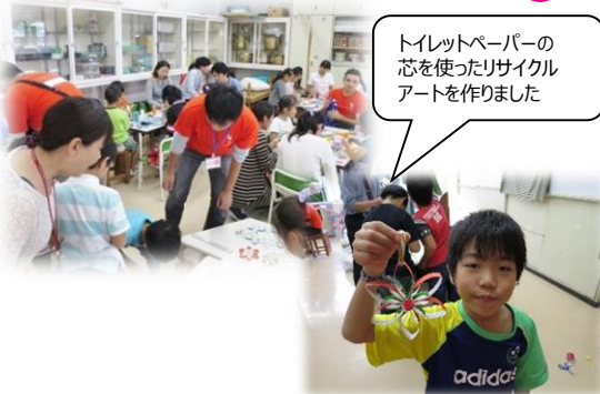
トイレットペーパーの芯を使ったリサイクルアートを作りました