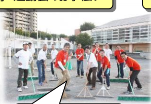
競技用具の出し入れなどのお手伝い