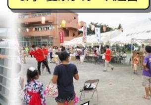
ストラックアウトは大好評でした！