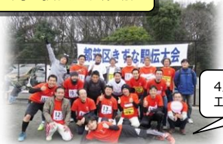
4人1チームで5チームエントリーしました