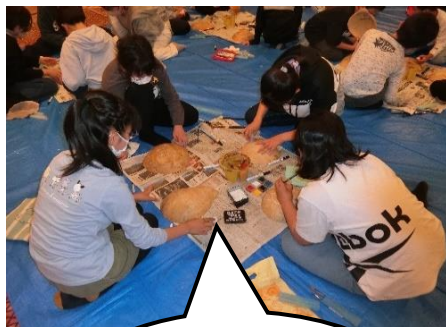
ふくべ細工では、 楽しい作品がたくさん できました。