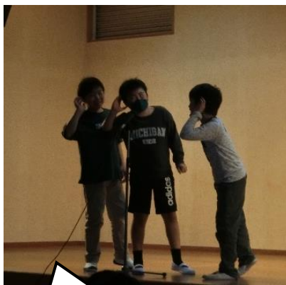
学年レクは大盛り 上がり。学年 のまとまりを感じ ました。