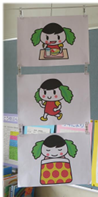
免疫力向上のために