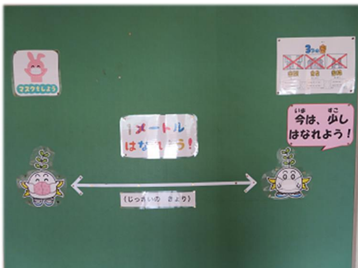
ソーシャルディスタンスを実感するために

子どもたちが自ら感染防止のための行動をとることができるよう、視覚的な手立てを用いるなどして、意識を高めています。