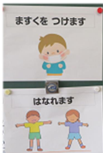
発達段階に応じた掲示物で意識向上