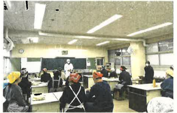
中にはお父さんやおじいちゃん、おばあちゃんの姿も。