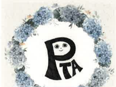
今年デザインされたPTAのロゴ

(E) ん～最初にまず1週間くらい時間もらったかな？最初電話いただいてから。「どうしような～」と思いながら、1週間「ん～」って考えて。それで読み聞かせで学校に来てる時に役員さんから、実際話聞いて。「できますかあえ？」って聞いたら「できるよ！いち保護者って感覚で」って言われて。