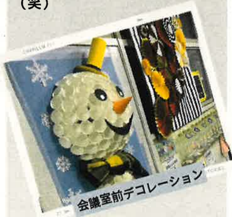
会議室前デコレーション