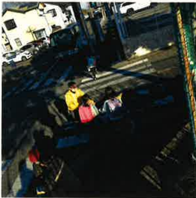
クリエイト前の交差点。信号点滅時間が短く、渡り切れない子どもも多い。

横断歩道を渡るとき、信号が点滅し始めたらどうしますか？急いでかけぬける？それとも止まる？警察指導では原則、点滅信号は「止まれ」のサインとしています。信号が点滅し始めたら無理をせず、次に信号が青になるまで待ちましょう。(横断歩行中である場合を除く。) キッズパトロール隊の方々も交差点を駆け抜ける子どもたちに毎回冷や冷やしているそう。