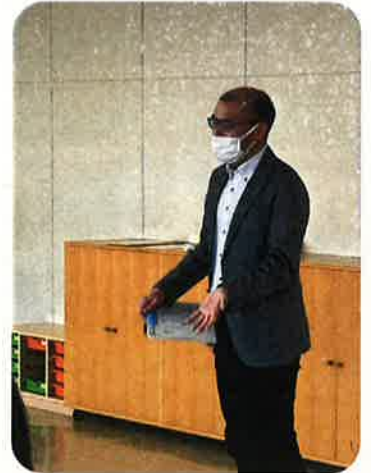
支援専任教諭。アンガーマネジメント、コーチング、ビジョントレーニングなど様々なアプローチで子どもの学校生活をサポートしている。

講習会の中では怒りの感情の仕組みや怒る時の3つのルール、更には怒らずに自分の気持ちを相手に正しく伝えるための「アイ・メッセージ」や「安心する3つの言葉かけ」について教えていただきました。アイ・メッセージとは「あなた」ではなく、「わたし」を主語にして自分の気持ちを伝える方法。早速、「お母さんは宿題やらない〇〇(子どもの名前)を心配しているよ」など、自分を主語にして気持ちを伝えてみては？