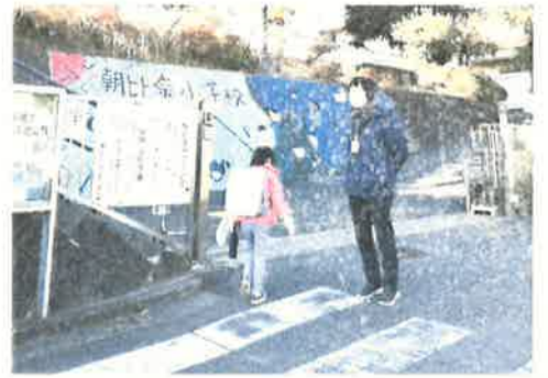
毎朝子どもたちの登校を見守る校長先生

日頃よりPTA活動、学校の教育活動へのご理解とご協力をいただきありがとうございます。今年度は新型コロナウイルス感染症への対応でPTA活動、学校行事の変更を一部行いました。PTA役員と相談しながら進め、昨年度よりは実施することができました。活動を全く無しにするのは簡単ですが、感染症対策などに配慮をしながらできる範囲で行いました。これが可能であったのもご家庭の皆さんが日々の生活やお子さんの健康に気を付けてくださったおかげと感謝しております。今後は、子ども自身が自分の健康状態に気を付けられるようにしていきましょう。