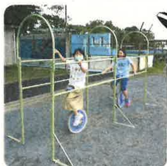
ベルマーク貯金で買った 一輪車の練習手すりは大好評！