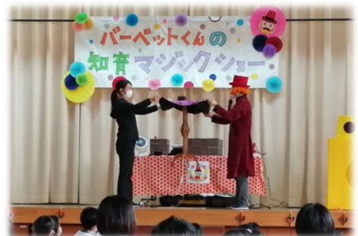
あがれ～！！と言うと机が浮きます！