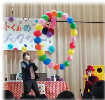
風船がクルクル回る～♪