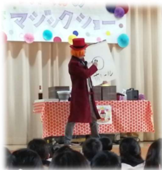
画用紙からボールが出た！

コロナ禍かつ緊急事態宣言中であるにも関わらず、楽しみにしていた子どもたちのために、基本的な感染症対策をはじめ様々な工夫を施し、開催に向けてご協力いただいた学校関係者やお手伝いの学年委員の皆様にご改めて御礼申し上げます。