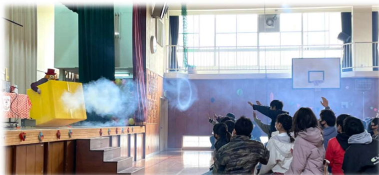
バーベットくんから空気砲（ドーナツ）のプレゼント、大盛り上がり！