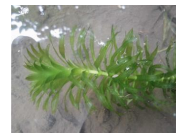
ホタル池のオオカナダモ

9月のホタル池活動は雨のため中止にしました。夏の間水路が埋まり水量が減ったホタル池は流れ込んだ土が底に堆積し、池の周りも草が生い茂ってましたからとても残念でした。すると数日後、ホタル池が荒れていることに気づいた5年2組の子どもたちが、総合的な学習の時間を使って水路を整備してくれました。このとき池の中にオオカナダモという植物が繁茂していたようですが、これも抜いてくれました。おかげで池の水は澄み、また底までよく見えるようになりました。ところで、オオカナダモはいったいどこから来たのでしょうか？