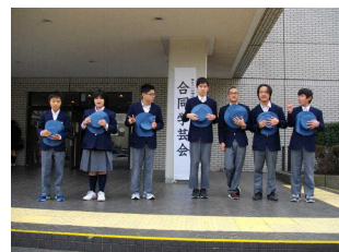
(会場(西公会堂)の前にて)