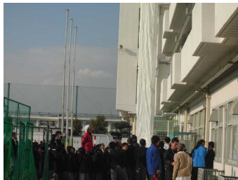
避難用救助袋体験