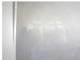
煙体験(よく見えません)