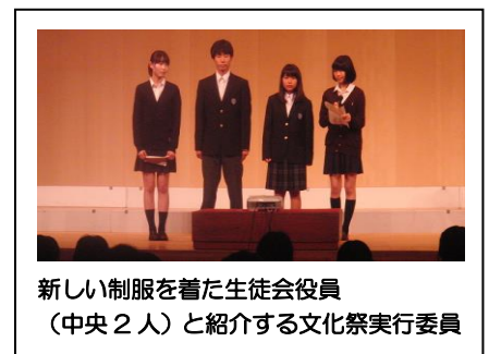
新しい制服を着た生徒会役員 (中央2人)と紹介する文化祭実行委員