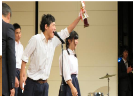
3学年 最優秀 3年2組