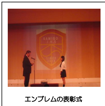
エンブレムの表彰式

さて、合唱の発表後は、来年度の制服や制服に付けるエンブレムの紹介をして幕を閉じました。