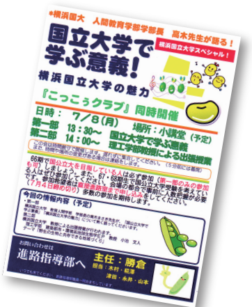
進路指導部から発行される各種通信