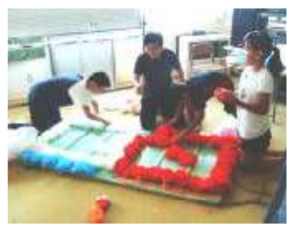
みんなの気持ちを盛り上げるための得点発表ボードを作成するもりあげ委員会です。