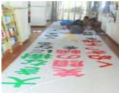
実行委員会で作成中。今年の運動会のテーマは・・・。開会式でドオンと発表します。