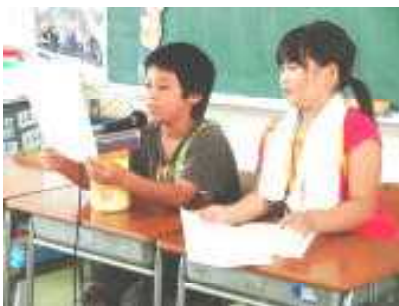
運動会を陰でリードする放送委員会。原稿を何度も何度も練習です！