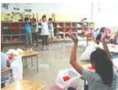
くぬぎ台小伝統の「夢をかなえてドラえもん」川島小のみんなも踊りに来てね！