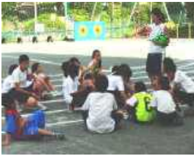
どんなルールにするとみんなが楽しめるか、作戦会議中の競技委員会です。

活動しながら、上級生としての自覚を身につけていくことをおおいに期待させてくれる、くぬぎっ子たちのがんばりです。