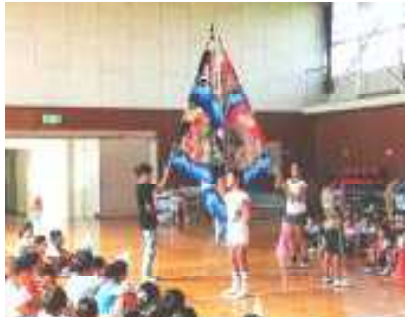
今年の大団旗は共に大漁旗。赤と青で色分けしています。